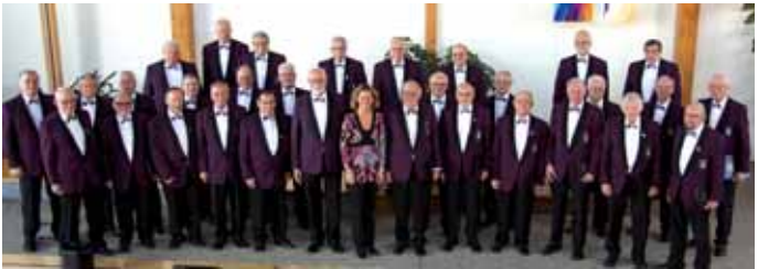
Chor BTV Graben

Ausrichter: Evangelische Altenhilfe Ronsdorf